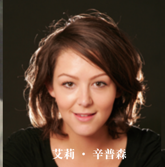
艾莉 · 辛普森